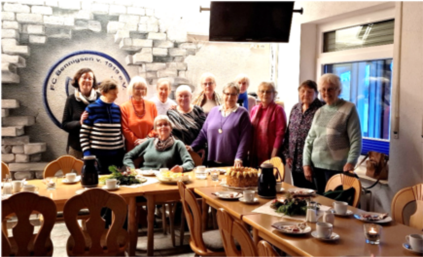
Weihnachtsfeier der Dienstagsgruppe (Seniorinnen) am 17.12.24