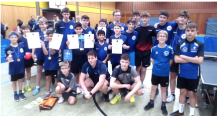
Großteil der aktiven Jugendlichen – gerne bald wieder mit Mädchen dazu

Dies würden wir für die Zukunft gerne ändern. Eine für das zweite Schulhalbjahr ins Leben gerufene Mädchen-AG soll ein direkter Versuch sein, wieder junge weibliche Talente zu uns zu locken.