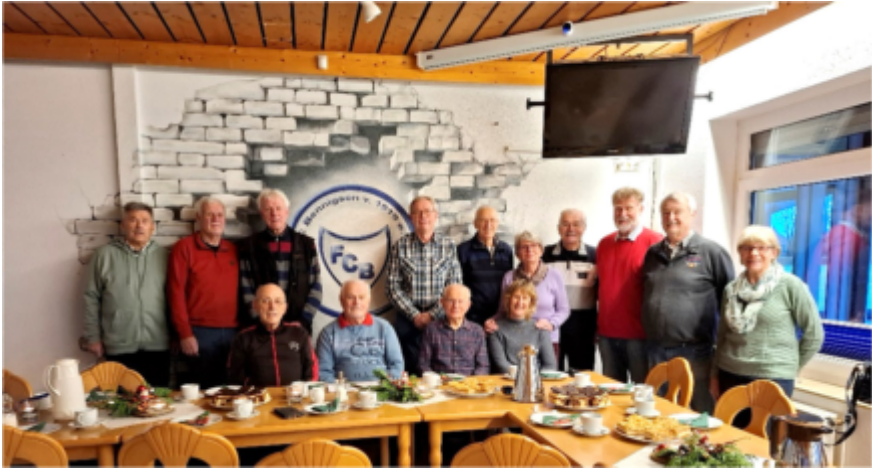
Weihnachtsfeier der Donnerstagsgruppe (Senioren) am 19.12.24